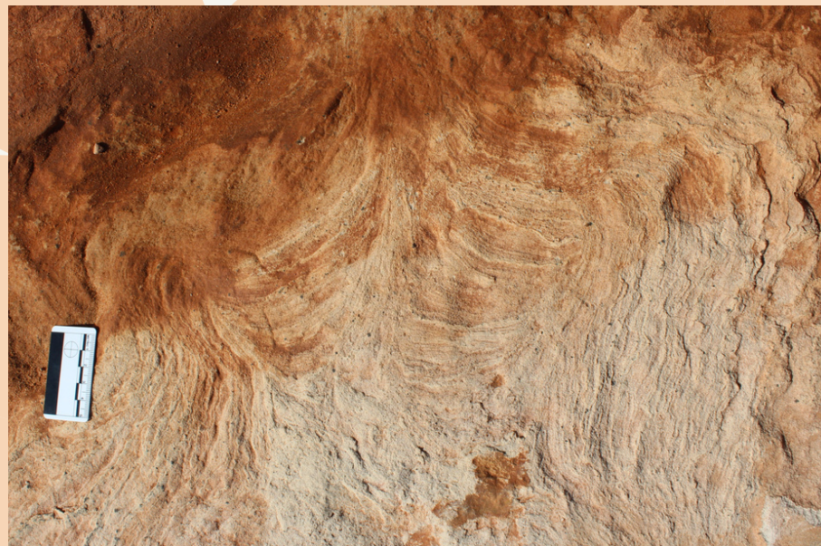
Pegada de Terópode

OBSERVAM-SE TAMBÉM PEGADAS DE DINOSSAUROS CARNÍVOROS, OS TERÓPODES.