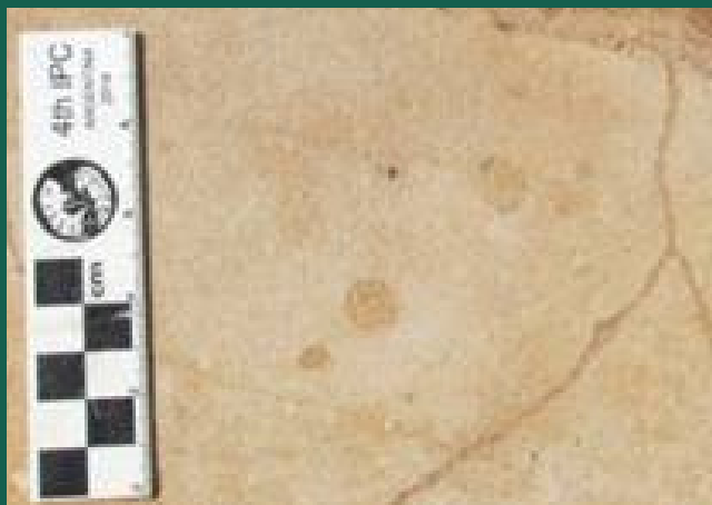
Toca de invertebrado.