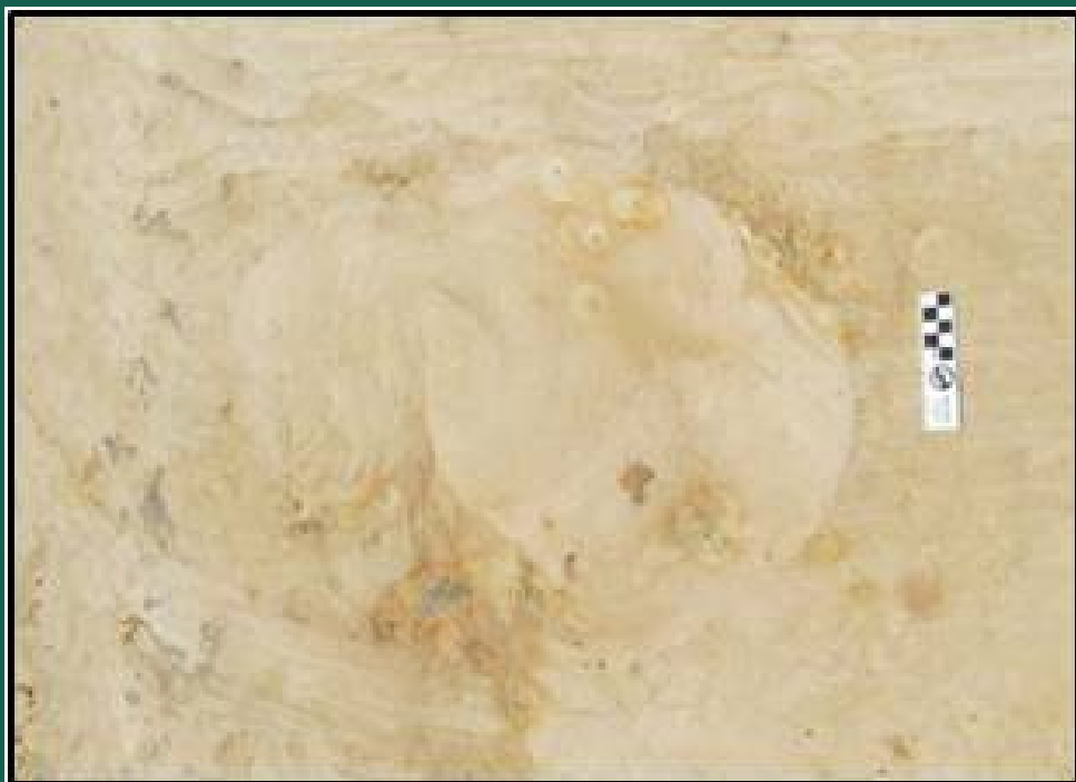
Toca de mamífero.