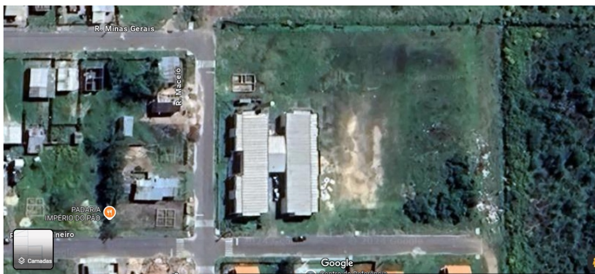
Imagem de satélite da área da Creche Pró-Infância