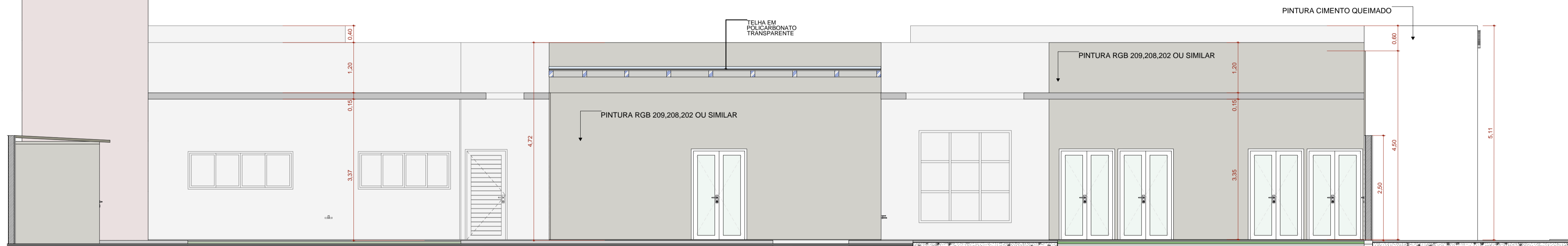
F4 FACHADA ESQUERDA