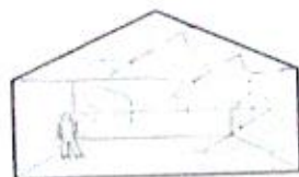
Reverberação do Som