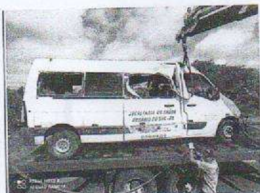
IMAGEM DA LATERAL DIREITA