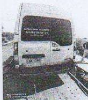
IMAGEM DA TRASEIRA