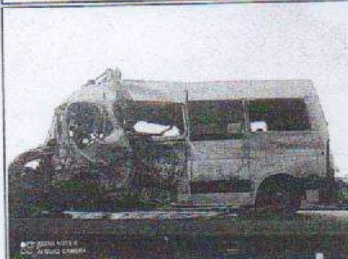
IMAGEM DA LATERAL ESQUERDA