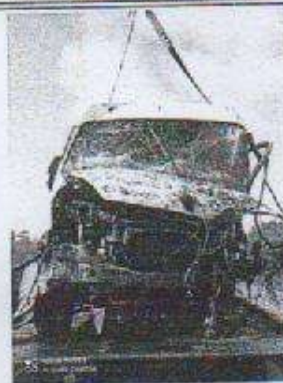
IMAGEM DA FRENTE