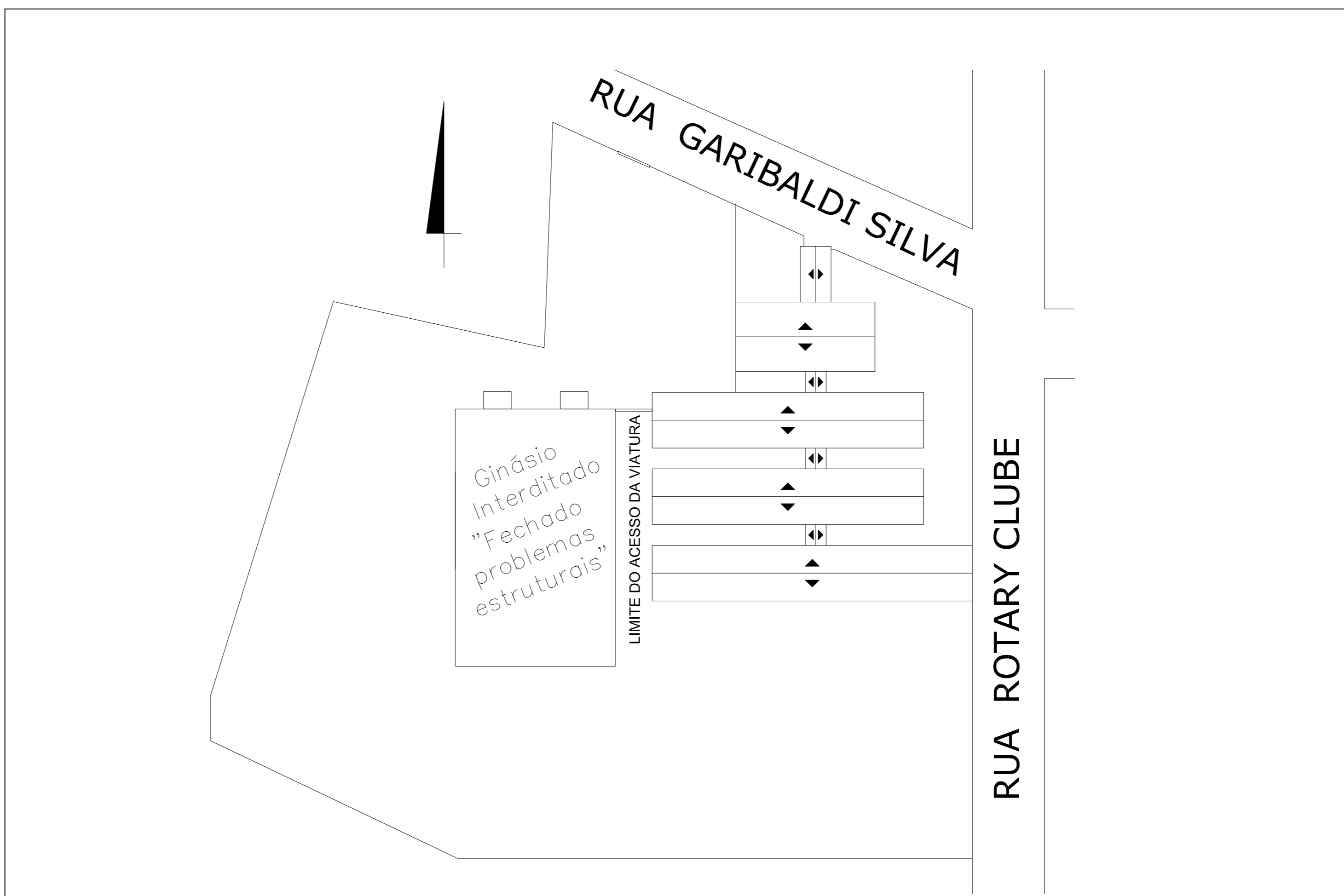
PLANTA DE SITUAÇÃO E LOCALIZAÇÃO ESC.1/500